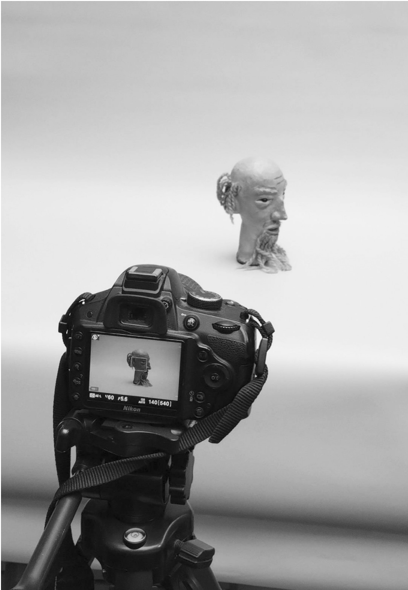
Digitalización de títeres de la colección del Museo Argentino del Títere